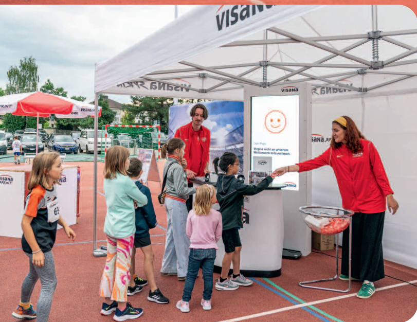
Vale sempre la pena di visitare lo stand Visana.